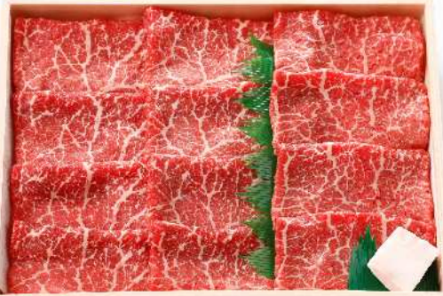
「やまぐち和牛 燦 黒毛和牛 すきやき」 有限会社 萩ミート販売