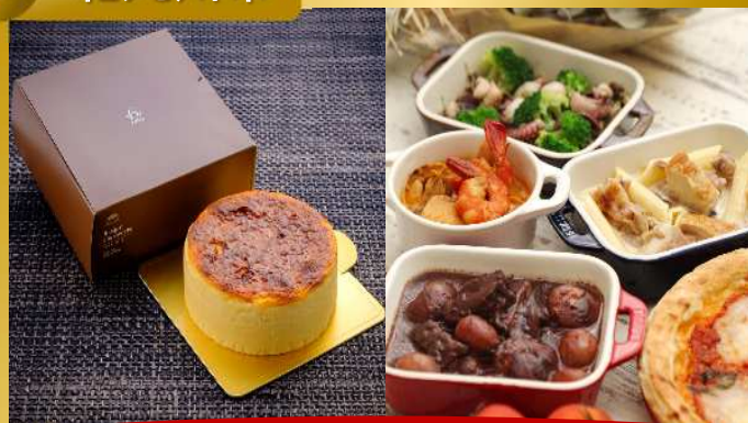
「バスケットチーズケーキ&洋風オードブルセット」 シックス・コージー by 千草ホテル