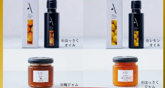
「フレーバーオイル&フルーツジャムセット」 山本倶楽部 株式会社