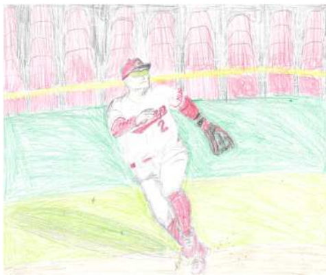
広島県 升本 篤史 君