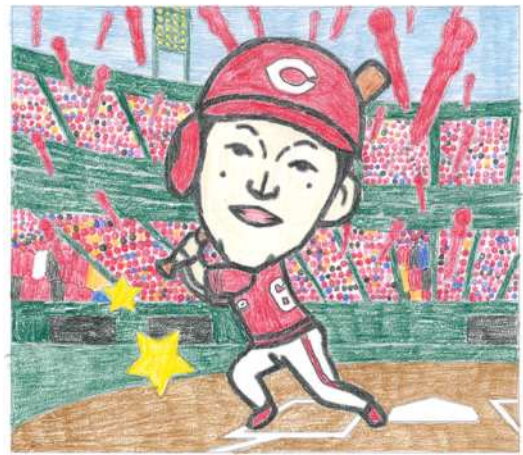
広島県 鳴川 翔太 君