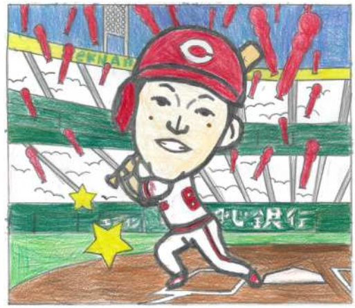
広島県 うさびよん くん