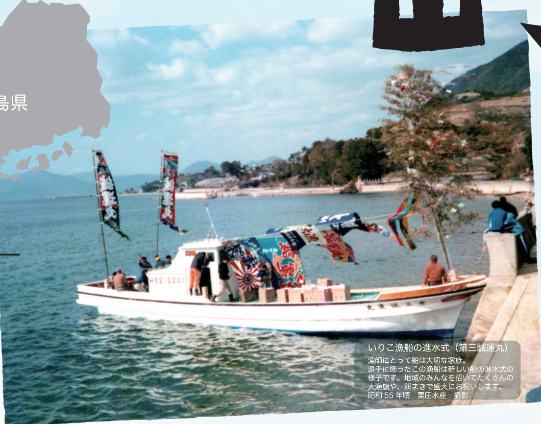
いりこ漁船の進水式（第三誠運丸）

漁師にとって船は大切な家族。 派手に飾ったこの漁船は新しい船の進水式の 様子です。地域のみんなを招いてたくさん の大漁旗や、餅まきで盛大にお祝いします。 昭和55年頃