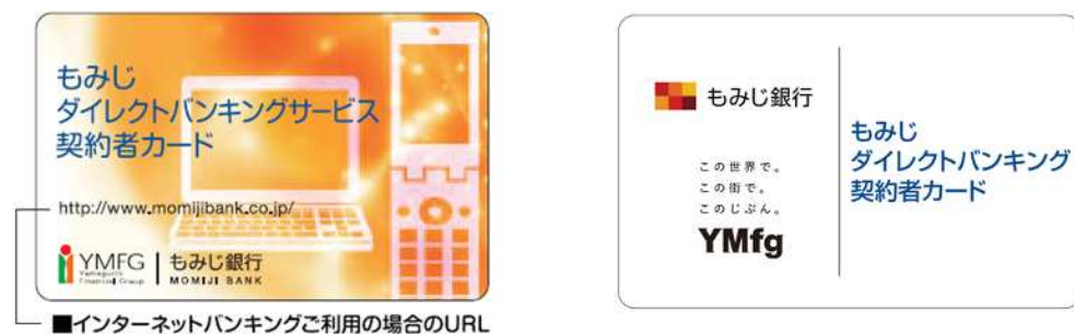
■インターネットバンキングご利用の場合のURL